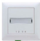
OTO – presa ottica della telecomunicazione (Optical Telecommunications Outlet)